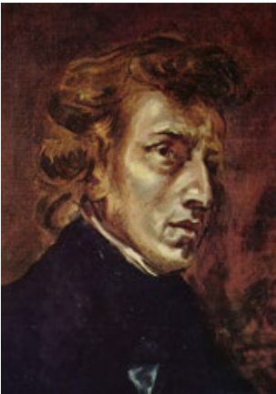
Frédéric Chopin, Gemälde von Eugène Delacroix (Ausschnitt), 1838, Louvre Paris