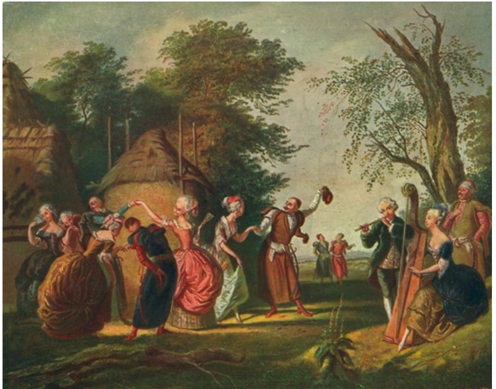
„Polonaise unter freiem Himmel“, Gemälde von Korneli Szlegel