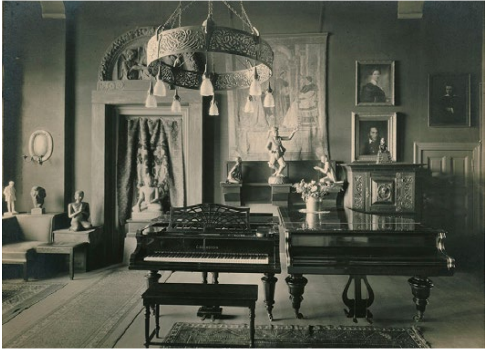
Musikzimmer von Ferruccio Busoni in seiner Wohnung am Viktoria-Luise-Platz 11 in Berlin-Schöneberg, um 1912, Stiftung Preußischer Kulturbesitz Berlin