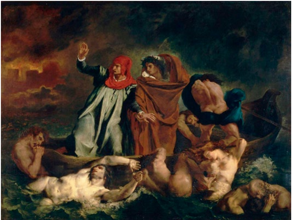
„La Barque de Dante“, Gemälde von Eugène Delacroix, 1822, Louvre, Paris

de Dante ist keine Programmmusik, die Dantes Begegnungen mit den unzähligen Bewohnern der Unterwelt nacherzählt. Franz Liszt komponiert nach der Dante-Lektüre ein musikalisches Inferno. Er entwirft einen donnernden, ächzenden und brutalen Raum, produziert von einem an seine Grenzen getriebenen Klavier, das unter den Schlägen zittert. Dichte chromatische Akkorde mischen sich im Nachhall zu disharmonischen Wolken. Dass es aus dieser Tiefe, aus der Dunkelheit kein Entkommen gibt, unterstreicht Liszt mit extrem langen Steigerungen. Disperato (verzweifelt) schreibt er mitten in die schier endlosen Crescendo-Prozesse. Für Interpreten sind die Folgen seiner Dante-Lektüre eine athletische Herausforderung.