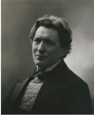
Ferruccio Busoni, 1913

„Die Chaconne ist mir eines der wunderbarsten, unbegreiflichsten Musikstücke. Auf ein System für ein kleines Instrument schreibt der Mann eine ganze Welt von tiefsten Gedanken und gewaltigsten Empfindungen. Hätte ich das Stück machen, empfangen können, ich weiß sicher, die übergroße Aufregung und Erschütterung hätten mich verrückt gemacht.“ Johannes Brahms, von dem diese Worte überliefert sind, blieb der Wahnsinn erspart. Aber er war von Bachs Chaconne besessen und veröffentlichte eine eigene Version für Klavier – allerdings nur für die linke Hand. Seit Bachs spieltechnisch ungemein herausforderndes Violinsolo im 19. Jahrhundert wiederentdeckt wurde, begeistert es das Publikum, bringt Geiger an ihre Grenzen, lässt Wissenschaftler über mystische Zahlenspiele und Choralbotschaften spekulieren und beschäftigt ganze Generationen von Komponisten, die sich das Werk auf den Arbeitstisch legen.