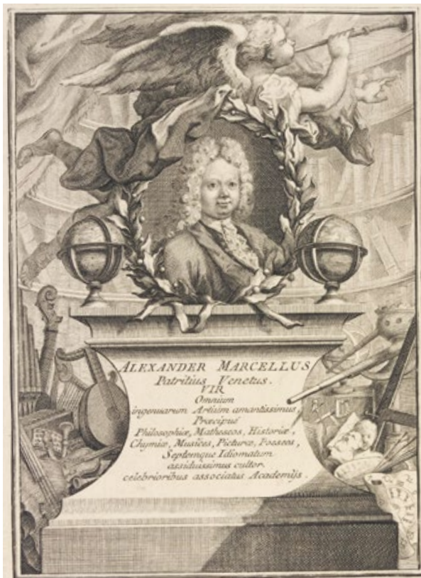
Alessandro Marcello Radierung 1701, Germanisches Nationalmuseum Nürnberg

Bei Alessandro Marcello lebte das Andante vom Wechselspiel zwischen den zu Beginn unisono spielenden Streichern und der Oboe, die das Anfangsmotiv fortspinnt und von den Streichern und der Continuo-Gruppe begleitet wird. Auch in Bachs Übertragung auf das Cembalo bestimmt die langsame Auffächerung der Stimmen und des Raums den Aufbau des ersten Satzes.