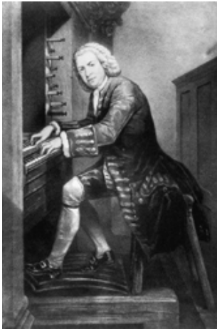
J. S. Bach an der Orgel Druck, ca. 1725

Herzog Johann Ernst IV. war ein äußerst junger Herrscher. Als Johann Sebastian Bach 1708 in den Dienst des Weimarer Hofes tritt, ist der Regent erst zwölf Jahre alt. Er teilt sich den Titel mit seinem älteren Halbbruder, während ein Onkel die Regierungsgeschäfte führt. Johann Ernst, ein passionierter und begabter Geiger, geht wenige Jahre später nach Utrecht, um an der Universität zu studieren. Auch seine musikalischen Interessen vertieft er. Die Musikzentren Amsterdam und Düsseldorf sind von Utrecht aus gut zu erreichen. Er kauft Noten, vor allem von italienischen und französischen Komponisten und schickt sie nach Hause. Die Weimarer Musiksammlung ist damals unter Kennern berühmt. In der Notenbibliothek finden sich aktuelle Werke von Torelli, Scarlatti, Albinoni, Vivaldi und auch von Alessandro Marcello. Sehr wahrscheinlich stößt der Hoforganist, Kammermusiker und spätere Konzertmeister Johann Sebastian Bach dort auf das Oboenkonzert des venezianischen Universalkünstlers und -gelehrten Alessandro Marcello.